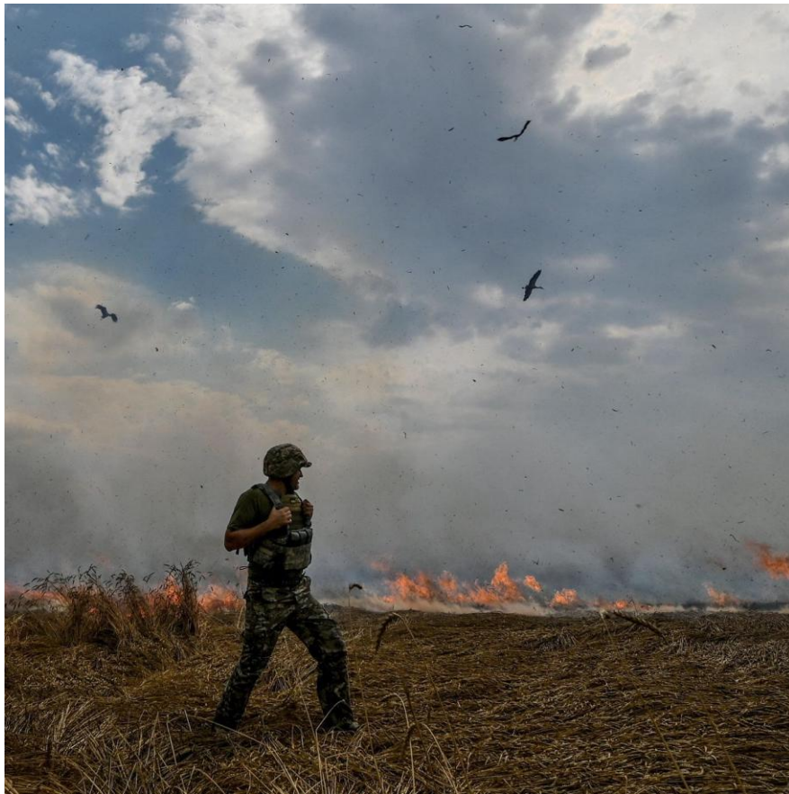
A wheat field burns near the front line on the border between Ukraine's Zaporizhzhia and Donetsk regions.